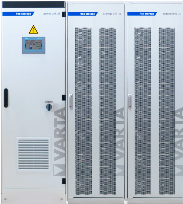
Abbildung 1: E 36/150 – beispielhafte Darstellung (Abbildung ähnlich)