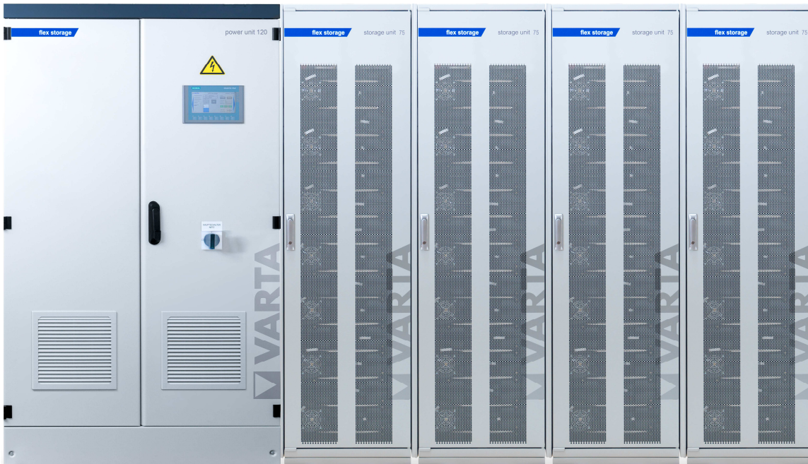
Abbildung 1: E 120/300 (170A ES) –beispielhafte Darstellung (Abbildung ähnlich)