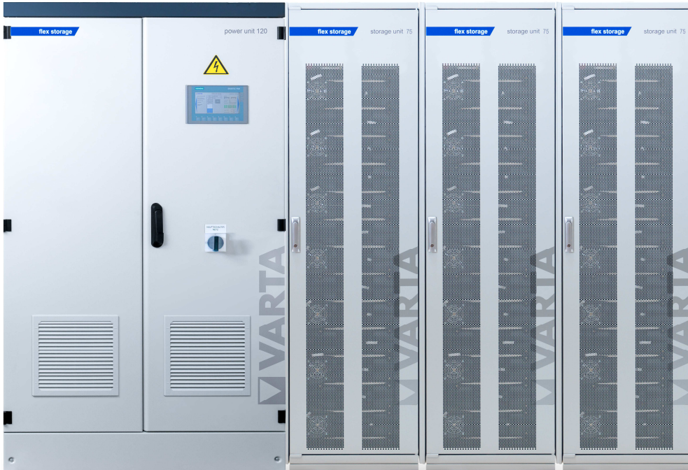
Abbildung 1: E 120/225 – beispielhafte Darstellung (Abbildung ähnlich)