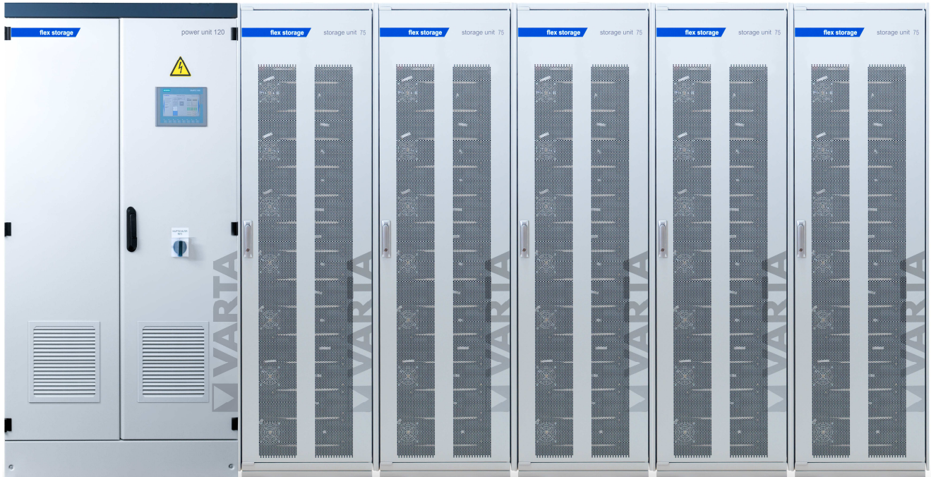
Abbildung 1: E 120/375 – beispielhafte Darstellung (Abbildung ähnlich)