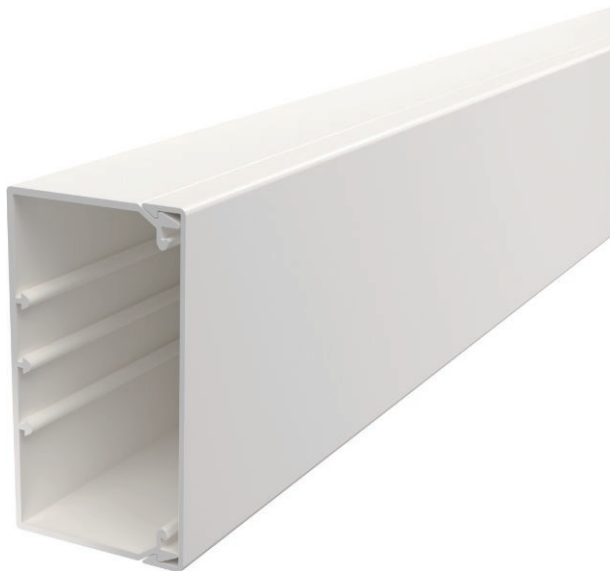
Kanaloberteil und -unterteil mit Bodenlochung.